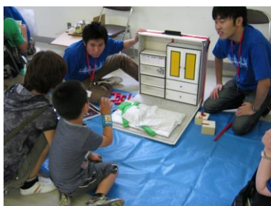
①家具転倒防止ワークショップ