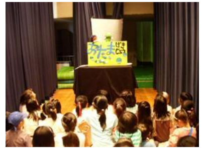
おたま劇場・アニメ上映