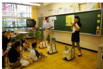
①エネルギーのかばん