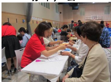
端切れでコサージュ作り