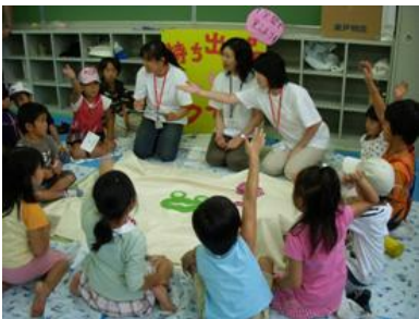
持ち出し品なあに？クイズ