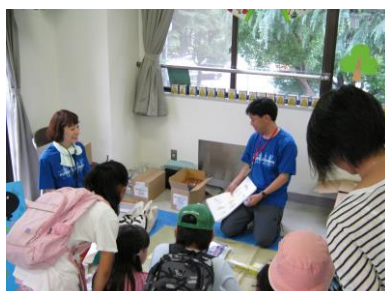
②持ち出し品なあに?クイズ