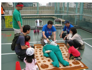
④毛布で担架タイムトライアル