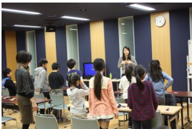
アナウンサー教室