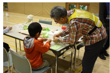
日用品で防災用品づくり