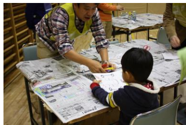
ペーパークラフト