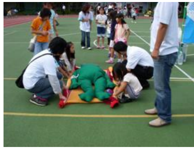
毛布で担架タイムトライアル