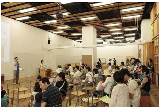
エコプラザで開会式