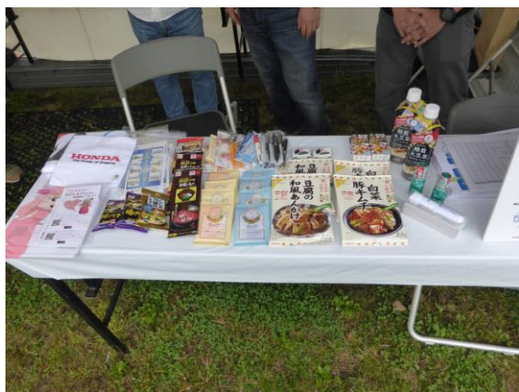
● 全6ブースのうち4ブースでクイズに答えると素敵な賞品をプレゼント