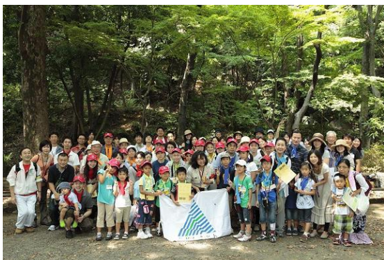
もみじ谷で集合写真