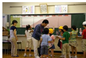
②未来は変えられる