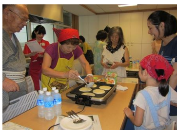
にこにこクッキング