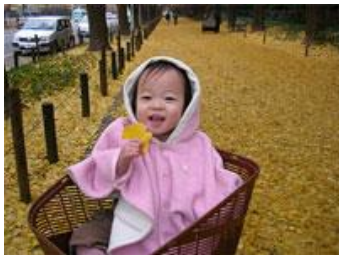
← 「これぞ芝浦」 ← 「この街で育っていく」