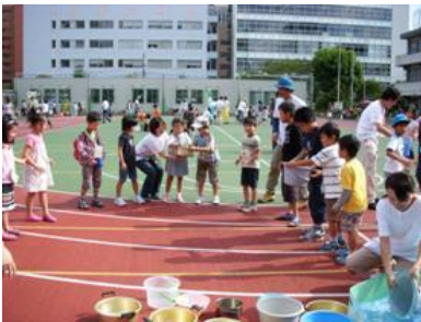
対決！バケツリレー！