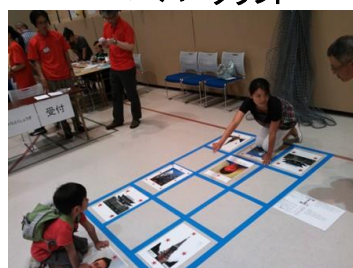
みなとくしょうぎ