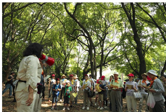
もみじ谷でビンゴゲーム