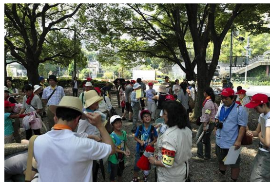
弁天池の前で発表