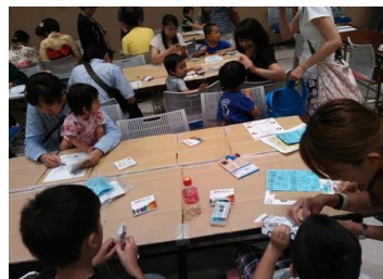
ペーパークラフト