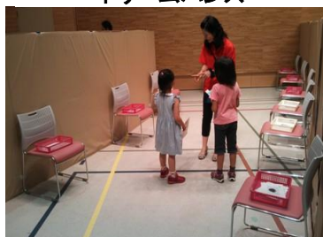
できるまでトライアル