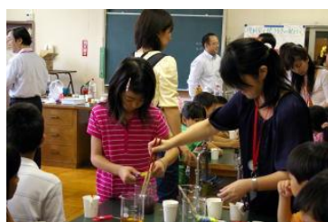
⑤廃油キャンドルづくり