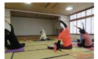
▲ヨガで心も身体もほぐし中

普段は関わりの少ない年代の人がサロンを通じて、ヨガも楽しみつつ気軽に語り合う場となっています。「今後はもっと活動を広めて、多くの人に参加してほしい」と展望を話してくれました。