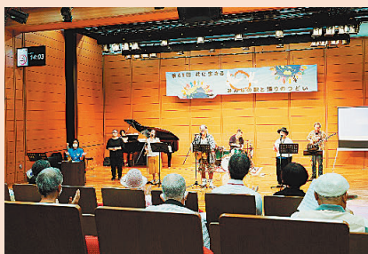
ステージ発表の様子

出演団体：港区立精神障害者支援センター あいはと・みなと／みなと工房／港特別支援学校(MOC)/KOKOZO 南青山／地上天国建設楽団／BTRD／朗読奉仕グループ「Qの会」他