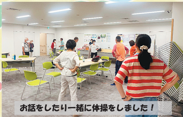
お話をしたり一緒に体操をしました！