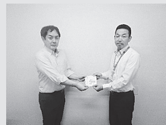
(株)プロネクサス 様

年末には年賀状のはがき募集を行います。引き続き、ふれあい通信“かんがり”へのご協力をどうぞよろしくお願いいたします。年賀はがき募集の詳細は、ボランティア情報 11月号に掲載予定です。