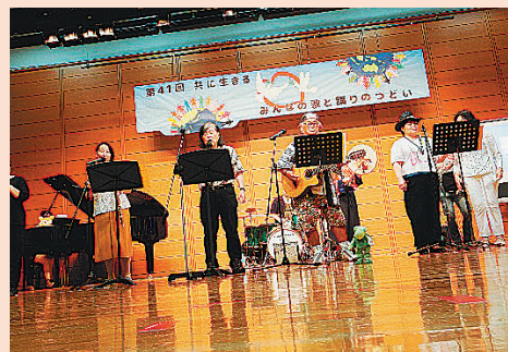
ステージ発表の様子

このイベントは、障害のある人もない人も、共に歌い、踊ることを通して「共に生きる」喜びを分かち合うことを目的に実施しています。