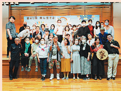
実行委員、団体の皆さん