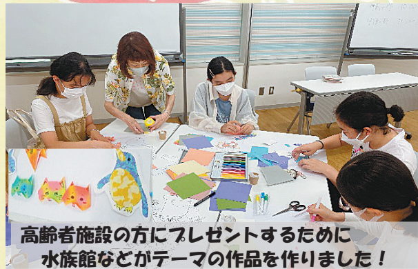
高齢者施設の方にプレゼントするために 水族館などがテーマの作品を作りました！