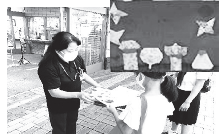
寄付いただいた折り紙でメッセージボードを作成し高齢者施設にお届け