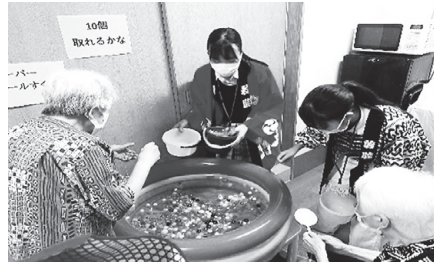
夏祭りのお手伝い