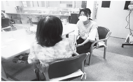
高齢者のお話相手

2022夏！体験ボランティアinみなとでは、35のメニューを用意し、学生や社会人など110名の申し込みがありました！皆さんの感想と活動の様子です。