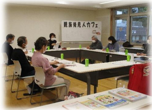
昨年度の様子（感染予防対策もしています）