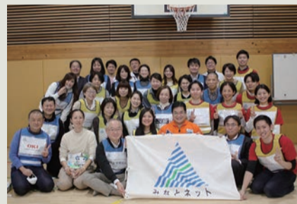
みなとネット会員