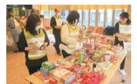
港区内の社会福祉法人が連携して募集・運搬等を行いました

集まった食品は、港区で子ども食堂や子育て家庭を対象としたフードパントリー等を実施する4団体にお渡ししました。