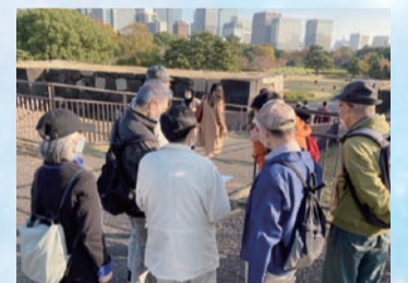
昨年度の修了者によるまち歩きの様子