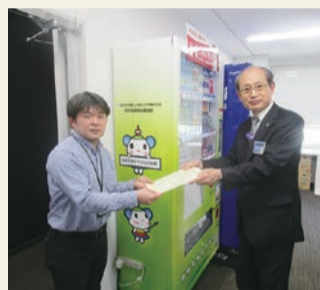
住友金属鉱山シボレックス(株)様へ感謝状を進呈しました

港社協マスコットキャラクター「み〜しゃ」をあしらったオリジナルデザインの自動販売機です。