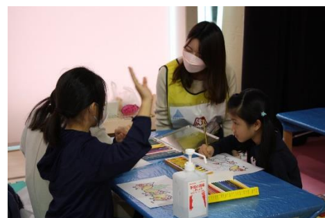
キヨロちゃん塗り絵の様子