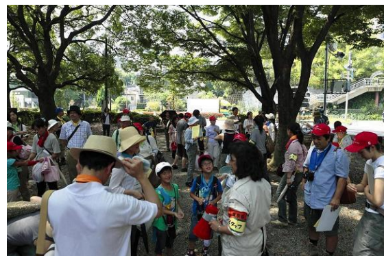
弁天池の前で発表