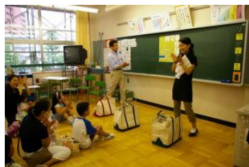
①エネルギーのかばん