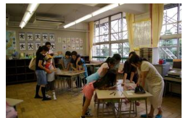
③食べ物を巡る物語