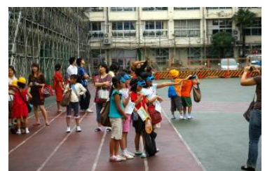
日食が見えたことに気付く