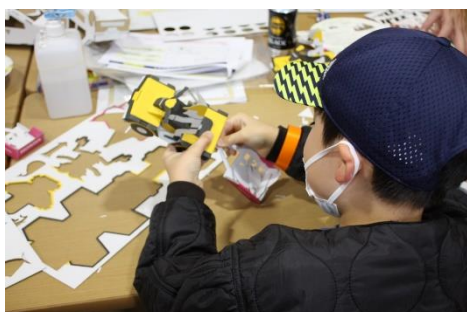
←ダンボールクラフト作り