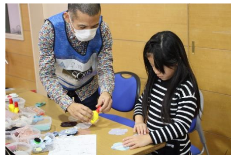
コサージュ作りの様子