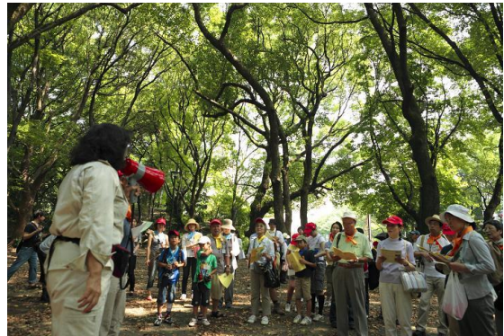
もみじ谷でビンゴゲーム