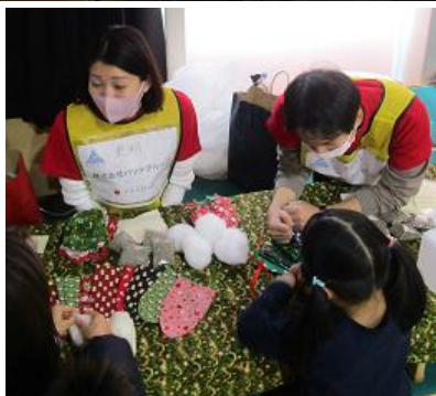
シューズキーパー作りの様子