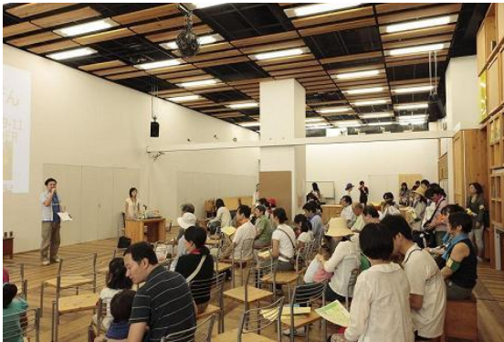
エコプラザで開会式