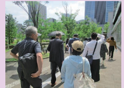
「港区を知るまち歩き」の様子