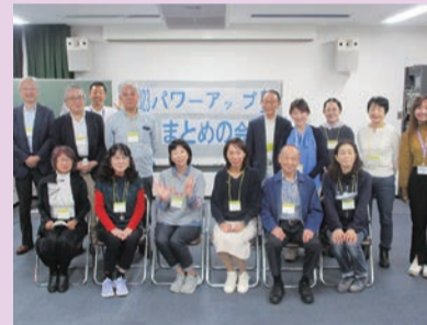
「まとめの会」の様子