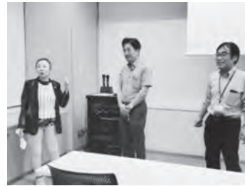
◀講師と会場の確認

行政施策「街づくり」及び「子ども支援」「高齢者問題」事業に加え、我が国未来財産と位置づける「留学生支援」を、組織として尽力出来る形で多角的に協働事業の推進を目的とする。