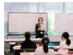
初級クラス1の様子▲

【問い合わせ】ボランティア・地域活動支援係(みなとボランティアセンター) TEL:6230-0284 E-mail: vc@minato-cosw.net