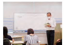
初級クラス2の様子▲