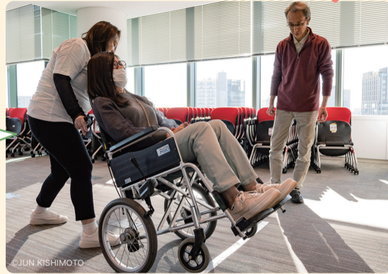
車いす体験の様子

参加者全員が車いすの「介助する側」と「介助される側」の両方を体験することで、車いすを使った移動に伴う一連の操作だけでなく、乗っている人の視点から見たコミュニケーションを意識するなど、とても実り多い気づきのある体験ができました。