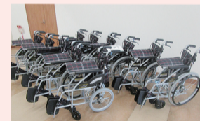
ご寄付いただいた車いす

また、当事務所のサステナビリティの取組に則り、1)子ども、2)不利な立場にいる人々、3)環境において、地域でさまざまな活動に参加しています。その一環として、今回車いす11台分の寄付を行いました。その他、(公社)東京都障害者スポーツ協会との連携など、今後も様々な取組を続けていく所存です。