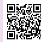
申し込みフォーム

5月12日(月)までに、申し込みフォーム・電話・FAXまたは電子メールで住所・氏名・電話番号明記のうえ申し込み。