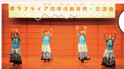
昨年度の発表・交流会の様子