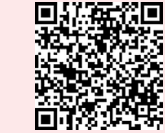
赤い羽根データベース はねっとはこちらから