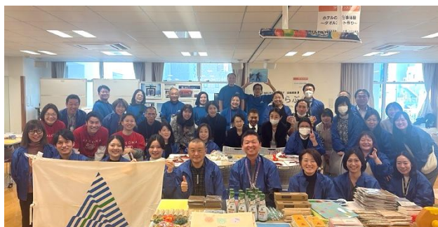
午前メンバー 集合写真