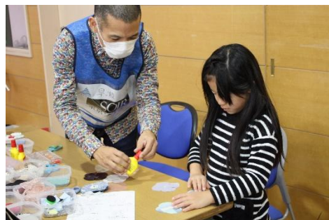
コサージュ作りの様子