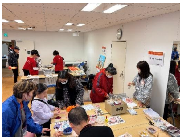
東京ソワール コサージュづくり