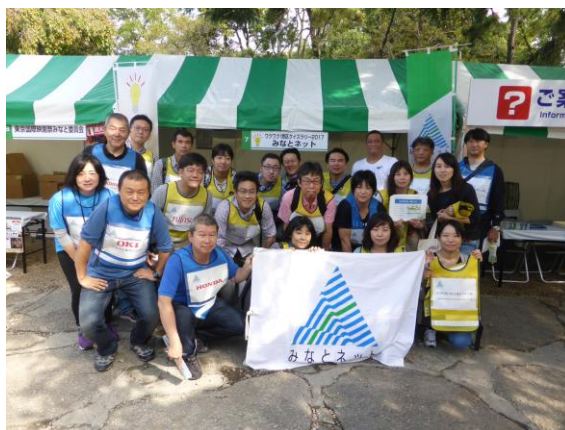
● 8 日集合写真