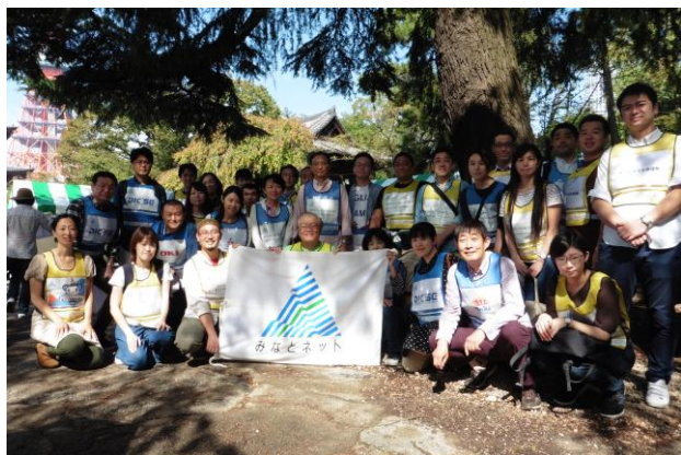
● 6 日集合写真