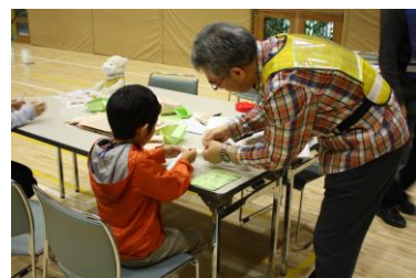
日用品で防災用品づくり