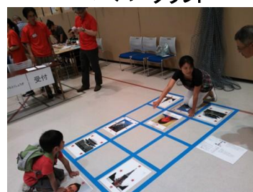
みなとくしょうぎ