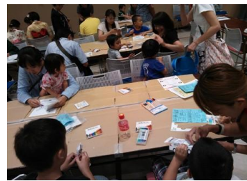
ペーパークラフト