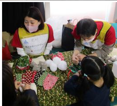
シューズキーパー作りの様子