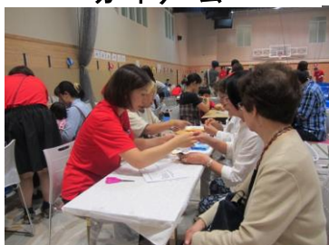
端切れでコサージュ作り