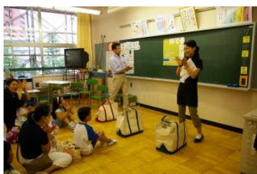
①エネルギーのかばん