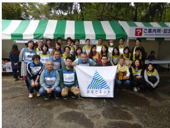
● 7 日集合写真