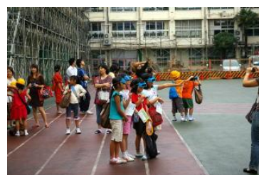
日食が見えたことに気付く