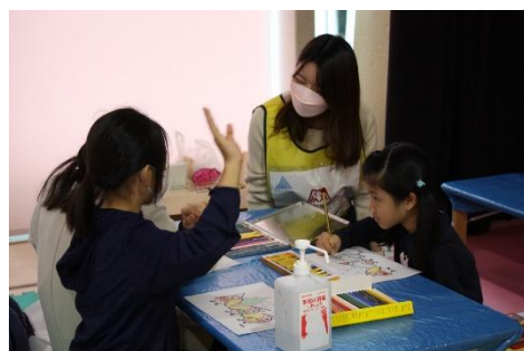
キョロちゃん塗り絵の様子