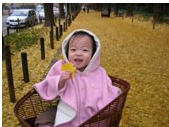
←「これぞ芝浦」 ←「この街で育っていく」