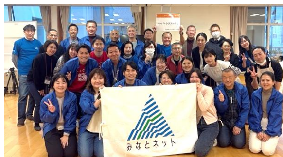
午後メンバー 集合写真