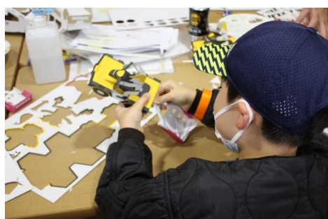
←ダンボールクラフト作り