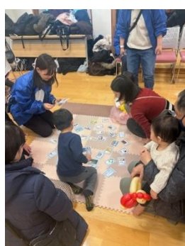
床・机 それぞれで白熱バトル