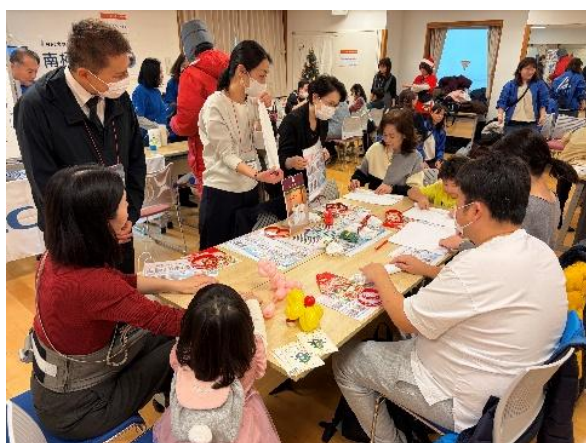
第一ホテル東京 タオルアート