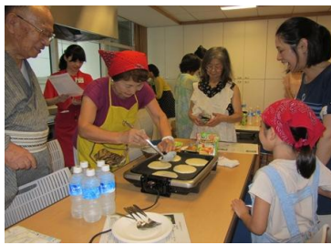
にこにこクッキング