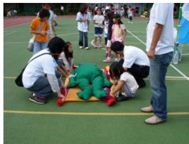
毛布で担架タイムトライアル