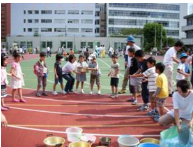
対決！バケツリレー！