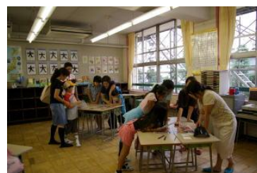
③食べ物を巡る物語