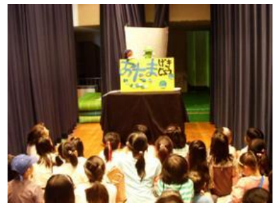
おたま劇場・アニメ上映