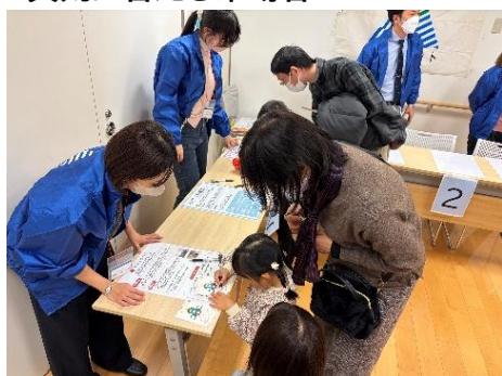
真剣に答える来場者