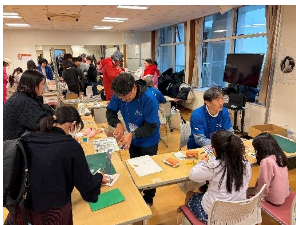
NEC ネットズエスアイ ペーパークラフト