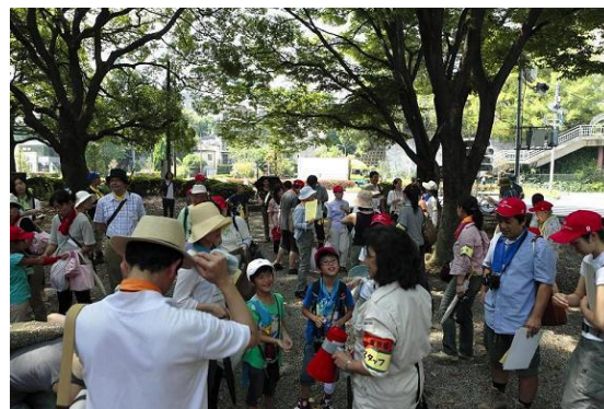
弁天池の前で発表