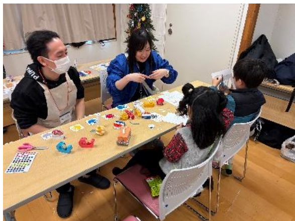
シーイーシー クリスマスオーナメント