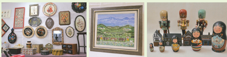
作品展ではトールペイントで描いた絵や、人形をペイントした作品を披露しました!

現在、私たちのような高齢者をはじめ、地域の皆さんがさまざまな場所でサロン活動やボランティア活動を楽しんで、いきいきと生活されていると思います。港社協の皆さんに感謝しています。