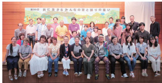
第39回のボランティアの皆さん