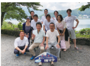
夏に企画された社員旅行での1枚